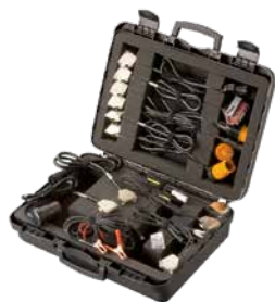
Kabelkoffer Europäische Fahrzeuge Art.-Nr. 6011000300