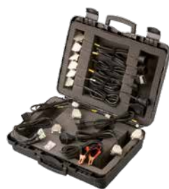
Kabelkoffer Asiatische Fahrzeuge Art.-Nr. 6011000305