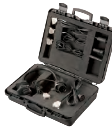
Maleta Cabos Reboques cód. 6011000321