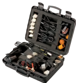
Maleta Cabos Veículos Europa cód. 6011000300