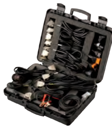
Maleta Cabos Truck Base cód. 6011000320