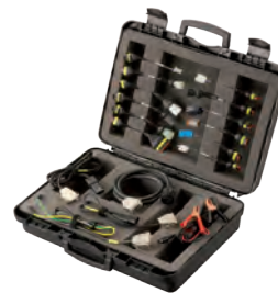
Maleta Cabos Moto cód. 6011000312