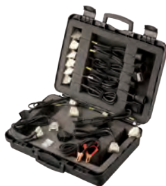
Maleta Cabos Veículos Asiáticos cód. 6011000305