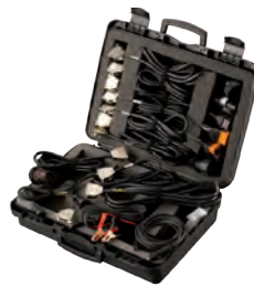
Coffret câbles Trucks Base N° réf. 6011000320