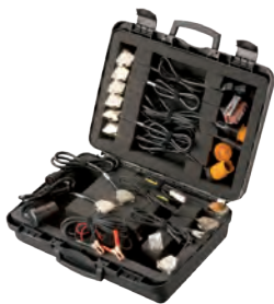
Coffret câbles Véhicules Europe N° réf. 6011000300