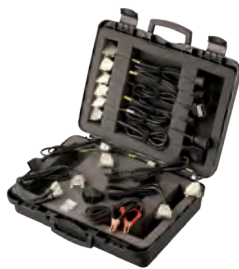
Coffret câbles Véhicules Asie N° réf. 6011000305