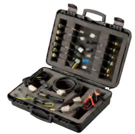
Coffret câbles Moto N° réf. 6011000312