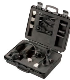
Coffret câbles remorques N° réf. 6011000321